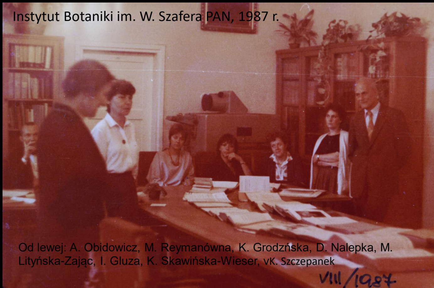
Instytut Botaniki im. W. Szafera PAN, 1987 r.