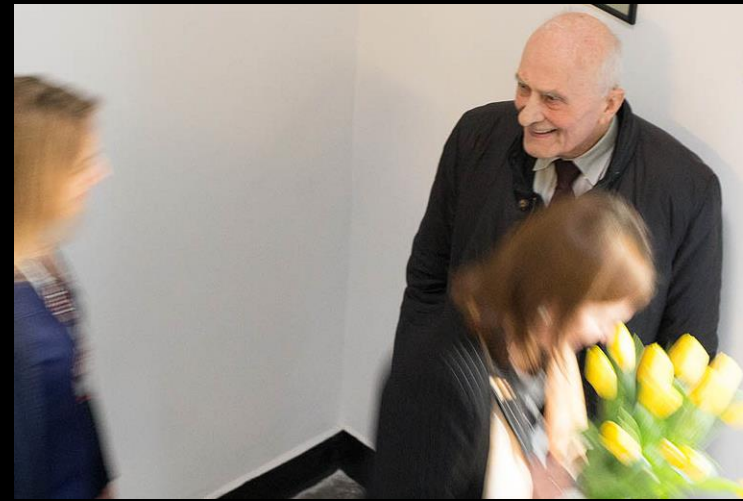
Kraków, 2015 r.